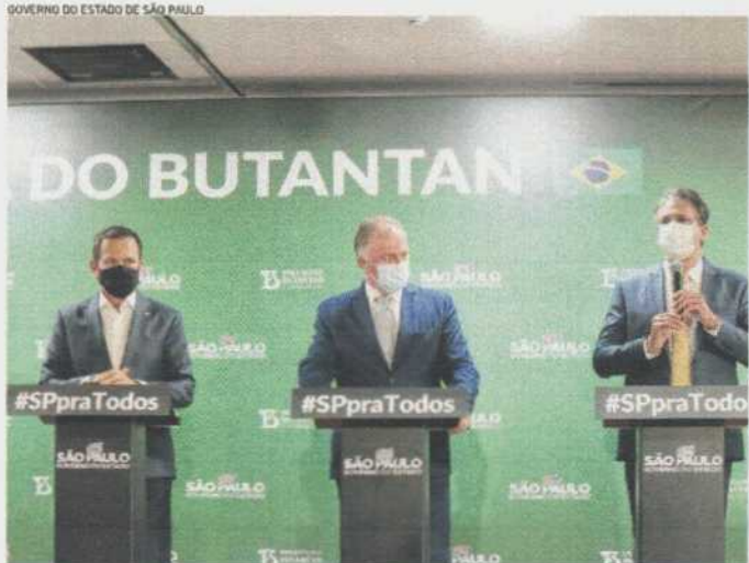
GOVERNADOR de São Paulo, João Dória; do Espírito Santo, Renato Casagrande; e do Ceará, Camilo Santana; na solenidade em São Paulo

Estado do Ceará - Prefeitura Municipal de Itapipub - Aviso de Licitação - Pregão Eletrônico nº 0021/2021 - Pregão Eletrônico nº 0021/2021, para a contratação de serviços de manutenção e conservação de equipamentos eletrônicos, com o objetivo de garantir a continuidade dos serviços prestados pelo Município de Itapipub.