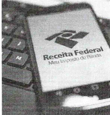
COM A entrada de mais 267 mil cearenses na faixa de isenção, 515 mil contribuintes não precisariam pagar o tributo sobre a renda

BEATRIZ CAVALCANTE beatrizcavalcante@opovo.com.br