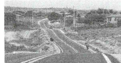
GOVERNO DO CEARÁ/CEARÁ/OS GMAA