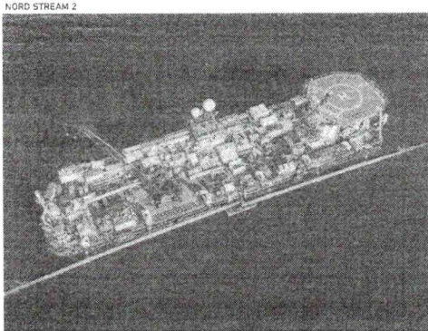
NORD Stream 2 foi construído no Mar Báltico, ligando Alemanha e Rússia