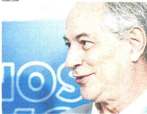
CIRO GOMES participou de aula magna de inauguração da Escola do Parlamento na Câmara Municipal

Outra vez questionado por O POVO, Ciro respondeu: "Meu irmão, chega de intriga". E adicionou: "Deixa eu só dizer uma coisa, toda a direção nacional do PT foi condenada ou presa. Então, não venha de graça, que você está me perguntando pra fazer intriga."