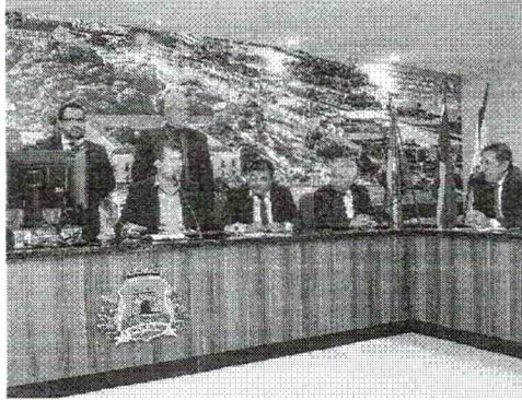
VEREADORES se reúnem nessa quarta e aprovaram proposta na Comissão Conjunta