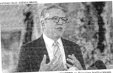
MINISTRO de Relações Institucionais Alexandre Padilha