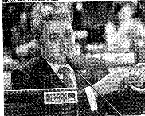
SENADOR Efraim Filho pediu celeridade na apreciação da proposta