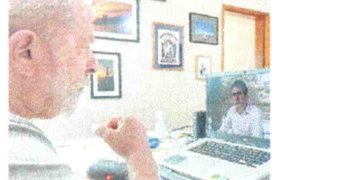
LULA se reuniu nesta segunda, 31, com o governador Camilo Santana

da decisão do Supremo Tribunal Federal (STF) que anulou as condenações contra o petista, no âmbito da Lava Jato, e tornou-o elegível. No mesmo dia, Camilo chegou a telefonar para o correligionário. Nas redes sociais, se referiu ao líder do partido como "um exemplo vivo de que toda luta por justiça vale a pena".