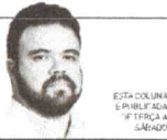
ESTA COLUNA É PUBLICADA ÀS TERÇAS-FEIRAS