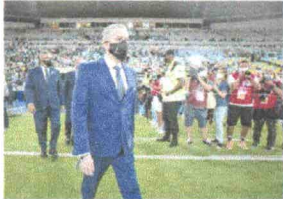
PRESIDENTE DA CBF, Rogério Caboclo: Copa América interessa a dirigentes