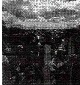
NA PRIMEIRA visita de Bolsonaro como presidente ao Ceará, em 26 de junho, população em Penaforte se espregueira para tentar vê-lo