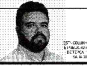
ÉRICO FIRMO LÍDER DO GOVERNO NO CEARÁ