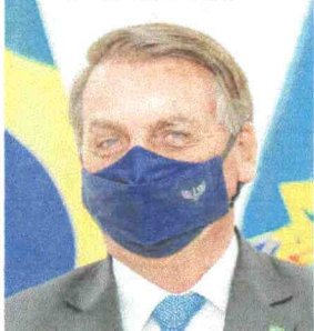
BOLSONARO visita o Cariri dia 13