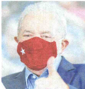
LULA ainda não tem data para viagem ao Ceará