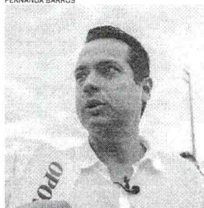
PREFEITO de Caucaia anunciou medida nessa quarta-feira

ESTADO DO CEARÁ - CÂMARA MUNICIPAL DE VAJAOZITO - AVISO DE LICITAÇÃO. A Câmara Municipal de Vajaozito, através da Comissão de Licitação, torna pública para conhecimento dos interessados, que no âmbito do 06 de Fevereiro de 2023, às 09:00h , estará aberto habilitação no modalidade TOMADA DE PREÇOS Nº 002/2023 , para contratação de serviços de CONSULTORIA E ACESSORIA ADMINISTRATIVA E ACOMPANHAMENTO DAS ATIVIDADES LEGISLATIVAS JUNTO À CÂMARA MUNICIPAL DE VAJAOZITO - CE . O interessado interessado no ato habilitação deverá apresentar em seu envelope o seguinte conteúdo: 1. Proposta de preço unitária para execução dos serviços de CONSULTORIA E ACESSORIA ADMINISTRATIVA E ACOMPANHAMENTO DAS ATIVIDADES LEGISLATIVAS JUNTO À CÂMARA MUNICIPAL DE VAJAOZITO - CE . O envelope deverá ser entregue no local de habilitação até o dia 06 de Fevereiro de 2023, às 09:00h, em seu endereço na Rua da Constituição nº 17, Bairro Centro - Vajaozito - CE - Vajaozito - CE, 19 de Janeiro de 2023. Juliana Xavieres Mesquita - Presidente da Comissão de Licitação.