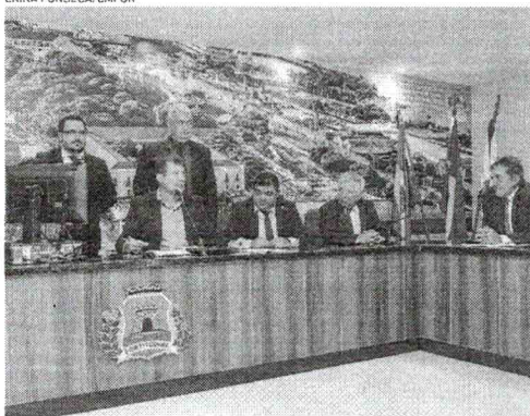
VEREADORES se reuniram nessa quarta e aprovaram proposta na Comissão Conjunta

agora na comissão mista um difícil trabalho de dialogar com a oposição sobre as 43 emendas sugeridas pelos vereadores. Tramitam, inclusive, emendas assinadas por vários membros da oposição, uma delas pedindo 100% de isenção na taxação.