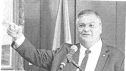
FLÁVIO DINO foi o nome escolhido por Lula para vaga de Rosa Weber no STF

O senador Weverton Rocha (PDT-MA), relator da indicação de Flávio Dino ao Supremo Tribunal Federal, disse nesta terça-feira, 28, que o ministro deve ter ao menos 50 votos favoráveis à sua nomeação ao STF.